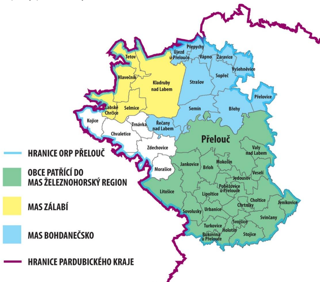
Obrázek 1 Území ORP Přelouč vč. MAS

Zbývajících část tvoří tzv. bílá území – obce, které se nenachází v žádném zájmovém území či nespádají pod žádnou jinou MAS.