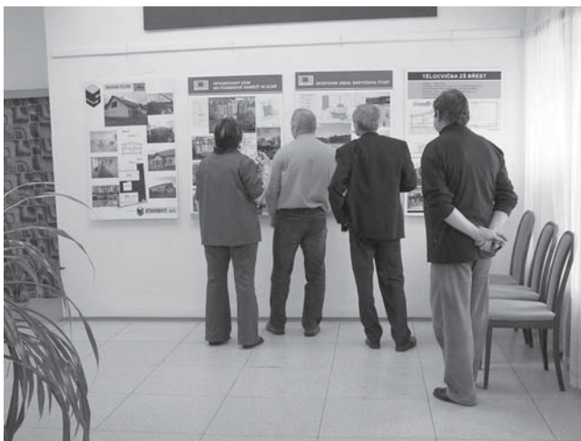
Z výstavy „Stavba roku 2004 Zlínského kraje“, která byla instalována ve společenských prostorách Městského úřadu.