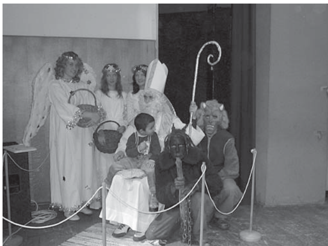
Mikulášská nadílka a rozsvícení Vánočního stromu u DD M

Poděkování patří také Církevní střední odborné škole v Bojkovicích za pomoc při organizaci letošního ročníku sbírky. Studentky CSOŠ byly dobrovolnice, které jste v ulicích města 15.9. potkávali s pokladničkami.