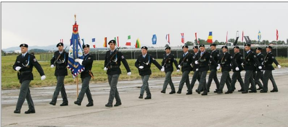
Foto: Čestná jednotka nese prapor Krajského ředitelství policie Moravskoslezského kraje po ploše ostravského letiště Leoše Janáčka v Mošnově...