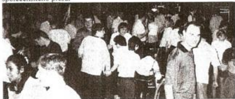
Zábavné odpoledne v Hajnici