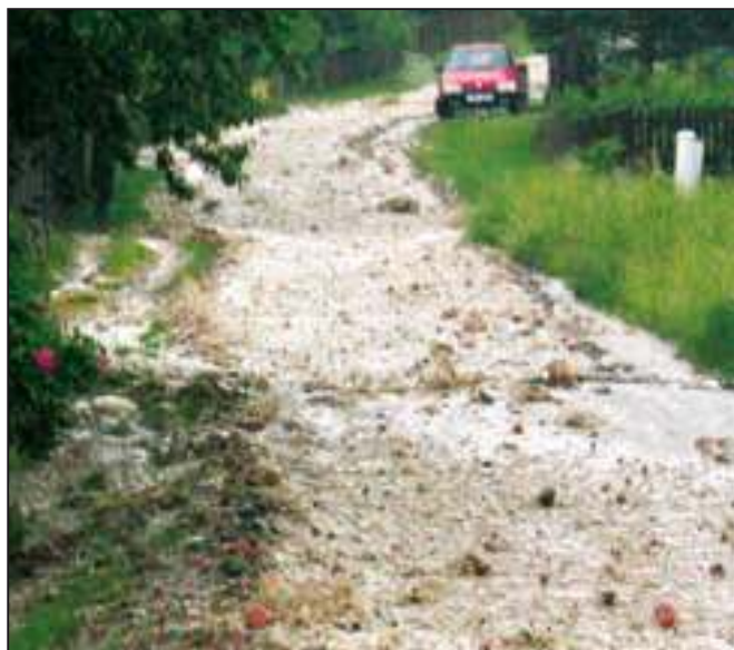
Průtrž mračen 3. 6. 2008 změnila cestu na Šmarhánkách v potok