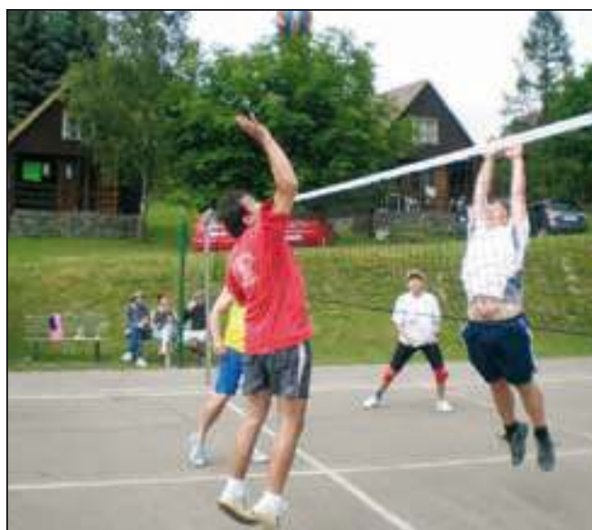
První volejbalový turnaj Hotelu Rusava