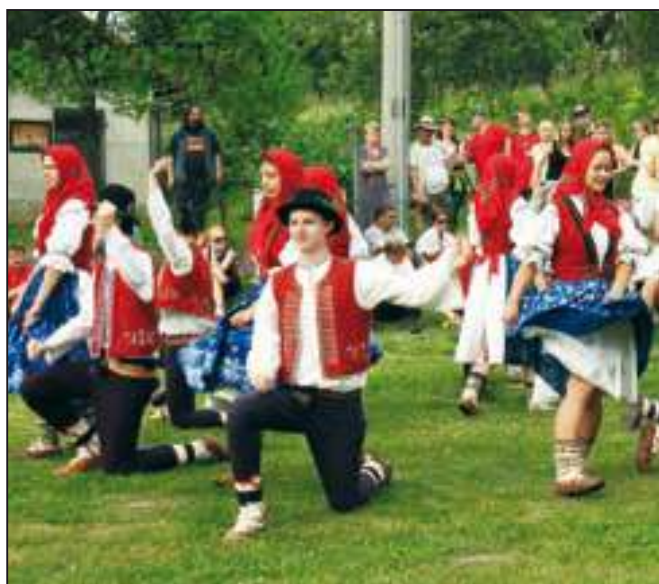
I letos se kácání mája vydařilo