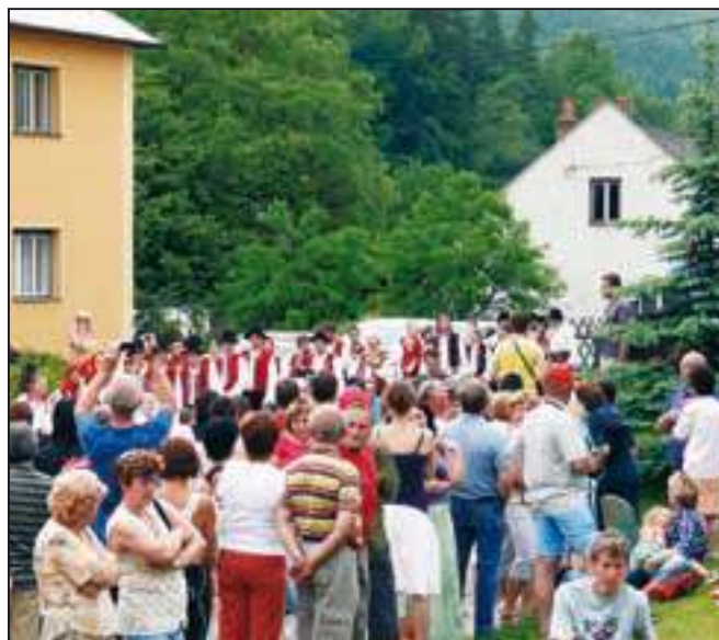
Májový průvod prošel celou obcí