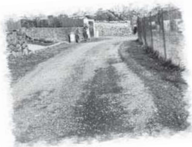
Cesta za evangelickým kostelem ^ Cesta za potokem ke Svobodům >