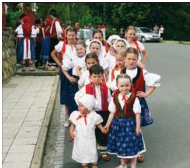
Májový průvod v čele s valašskou drobotinou