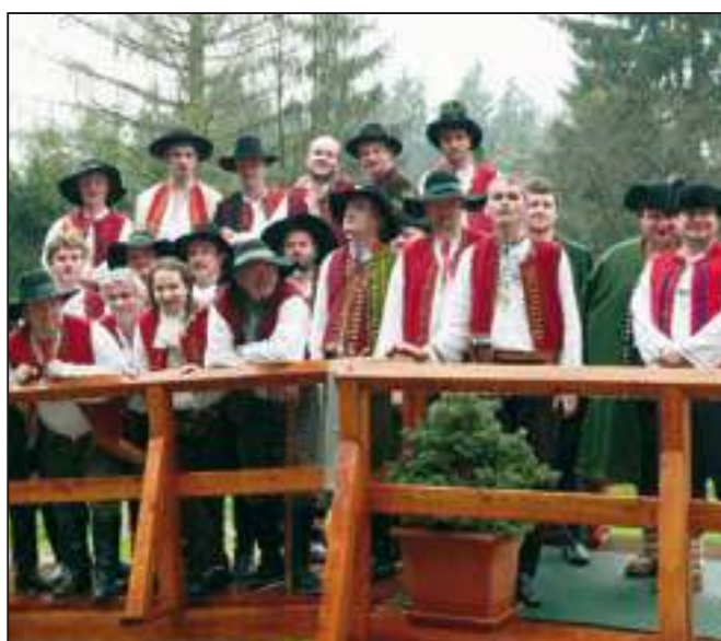
Pasování portášů na Grúni