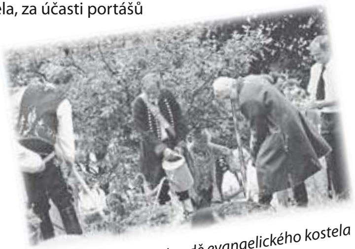
Výsadba jedle na zahradě evangelického kostela