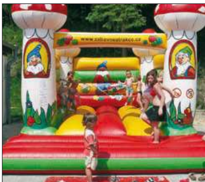
Na dětském dnu se nikdo nenudil