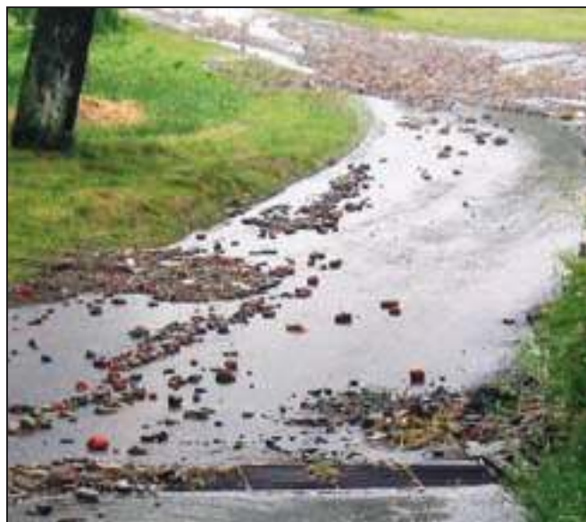
Vyplavené kameny a cihly z neodborně upravené polní cesty