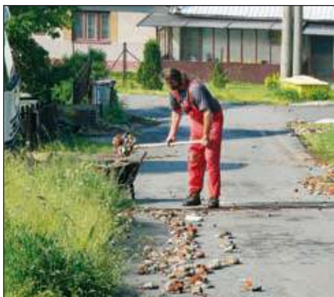
S nutným odklizením vypomohli i občané