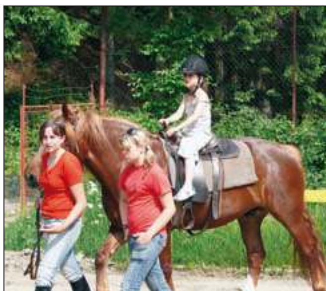
Pro odvážné děti byla připravena jízda na koni