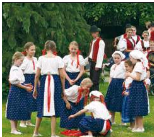
Svým vystoupením potěšily i děti z rusavského folklórního souboru Valášek