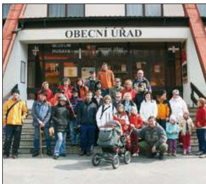
První ročník – Vítání jara na Pardusu